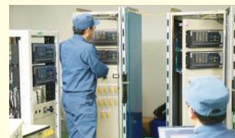
P&C製造工場 ※P&C:保護制御システム(GE製IED)