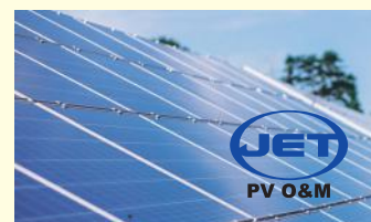
太陽光システム保守点検業者認証制度(JET)登録