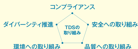
CSRの取り組みのページへ

社会インフラ設備のグローバル・エンジニアリング企業として事業活動を進めるなかで、安全管理体制の充実や環境負荷低減等の取り組みを行い、持続可能でよりよい社会の実現を目指しています。